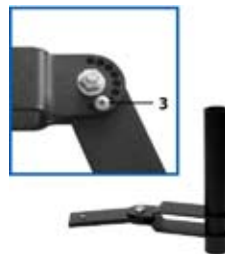
Angle piece BQE 02 Verbindungsstück BQE 02